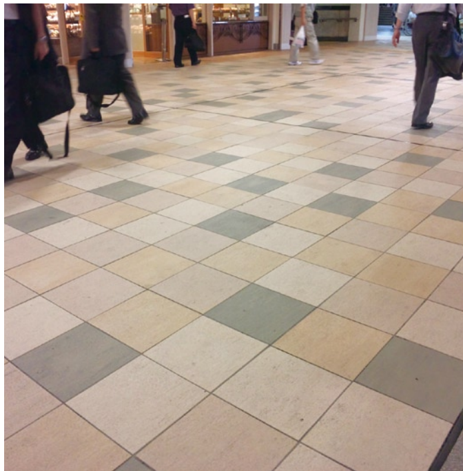
JR 東日本 品川駅構内